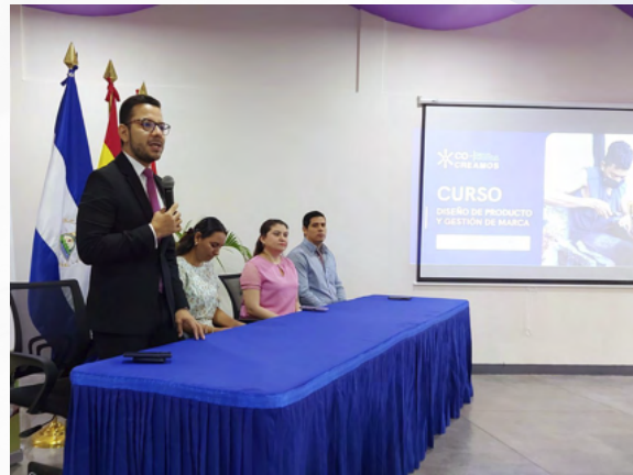
Apertura del Curso de Certificación en Diseño de Producto y Gestión de Marca.

El curso cuenta con la participación de 50 protagonistas de diversos sectores de la economía creativa nicaragüense, quienes han recibido becas completas que les permitirá ampliar sus conocimientos y capacidades de manera gratuita.