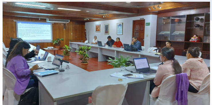
Sesión de Planificación para el Proceso de Implementación de la Metodología para la Promoción de Productos Estrellas en la Red Nacional de Ciudades Creativas

Esta iniciativa es parte del esfuerzo que realiza de manera articulada la Secretaría de Economía Creativa y Naranja de la Presidencia, el Ministerio de Economía Familiar y la UNAN-Managua; asimismo el proceso ha involucrado a instituciones de la Comisión Nacional de Economía Creativa, como el INIFOM, el INC e INTUR en coordinación con las Comisiones Locales de Economía Creativa de la Red Nacional de las Ciudades Creativas.