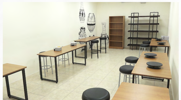
Foto: INATEC/Sala didáctica de artesanía del Centro Cultural y Politécnico José Coronel Urtecho, Managua.