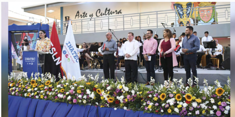
Acto de Inauguración del Centro José Coronel Urtecho, ¡No Volverá el Pasado!

La oferta formativa de Economía Creativa, también está diseñada para ofrecer a los protagonistas emprendedores, estudiantes y profesionales, cursos especializados en economía creativa, economía circular, economía social, colaborativa y la gestión de proyectos de economía creativa con énfasis en emprendimientos y negocios asociativos.