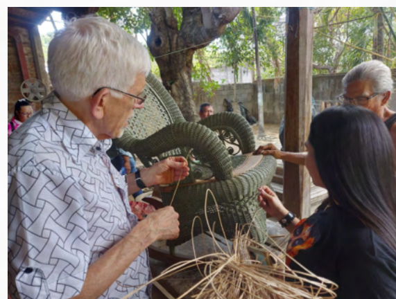
Visita a talleres representativos identificados en la Ciudad Creativa de Granada.