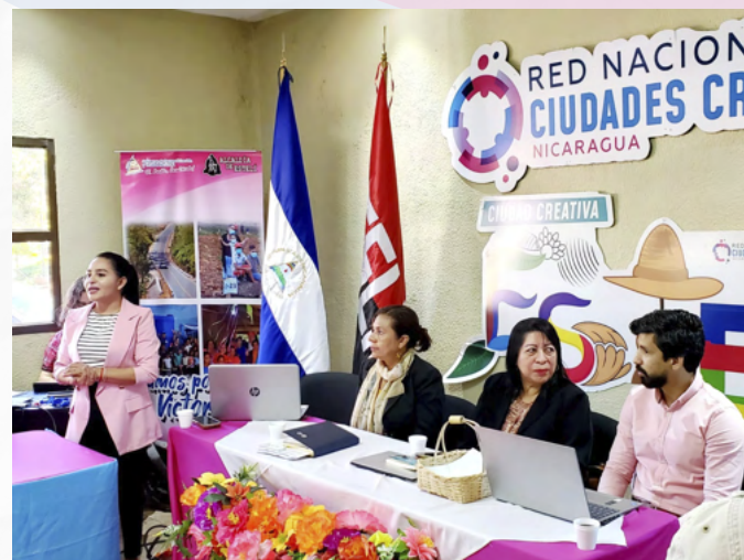
Sesión de trabajo con la Comisión Local de Economía Creativa de la Ciudad Creativa de Estelí, con el objetivo de iniciar el proceso de implementación de la Metodología de Producto Estrella.