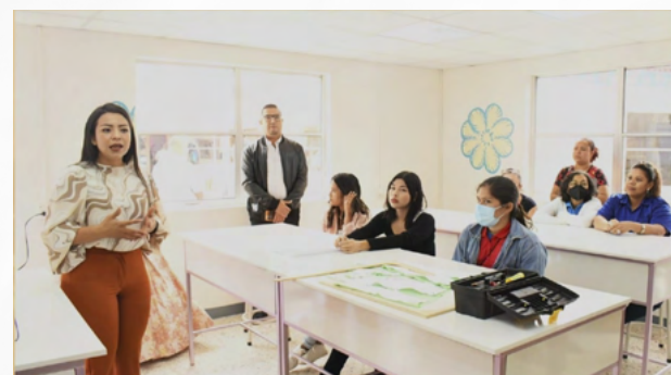
Aula didáctica del Centro Nacional de Desarrollo del Talento Creativo “Nieves Cajina”

El Centro para cada año se prevé una atención a más de 6 mil protagonistas, está ubicado de la Rotonda el Guegüense 4 cuadras al oeste y una cuadra al norte en Bolonia, cuenta con ambientes de aprendizajes altamente equipados como: taller de moda creativa, bisutería, cuero, estilismo y cocinas para artes culinarias.