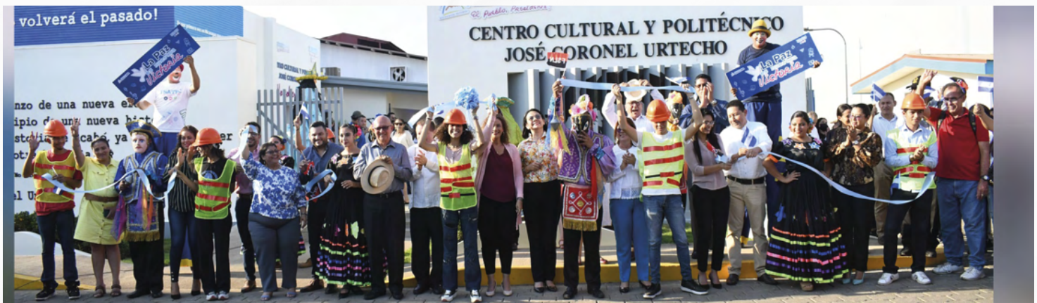
Corte de Cinta Inauguración del Centro Cultural y Politécnico José Coronel Urtecho

En conmemoración del día Nacional de la Paz, el miércoles, 19 de abril del 2023, nuestro Buen Gobierno Sandinista, a través del Instituto Nacional Técnico y Tecnológico – INATEC, llevó a cabo la inauguración oficial del Centro Cultural y Politécnico “José Coronel Urtecho”, ¡No Volverá el pasado! Un nuevo espacio de formación técnica y profesional, orientado al desarrollo de habilidades y capacidades desde las distintas disciplinas y expresiones del arte y la cultura, asimismo con una oferta especializada en temas de innovación, economía creativa, tecnología, industria, comunicación, finanzas, idiomas y oficios para emprender.