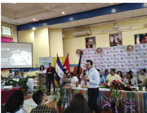
Encuentro con protagonistas y prestadores de servicios turísticos de Matagalpa

En el encuentro la Cra. Camila Ortega Murillo, Coordinadora General de la Comisión Nacional de Economía Creativa, destacó que desde el modelo de Economía Creativa se han desarrollado iniciativas orientadas a las mejoras de la producción del café, rubro considerado producto cultural de nuestro pueblo.