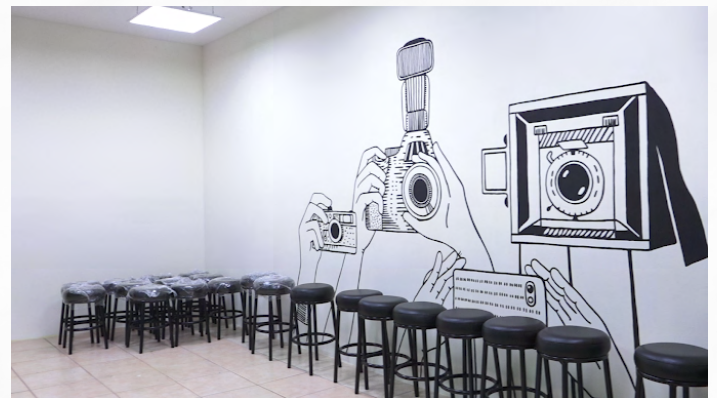
Foto: INATEC/Sala didáctica de fotografía del Centro Cultural y Politécnico José Coronel Urtecho, Managua.

Este centro de formación es parte del trabajo conjunto y complementario entre INATEC, MINED, INC, Cinemateca Nacional, Teatro Nacional Rubén Darío, MINJUVE, la Secretaría de Economía Creativa y Naranja de la Presidencia, Movimiento Cultural Leonel Rugama, aportando al desarrollo cultural, social y económico de nuestro país.