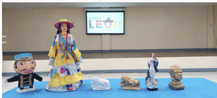
Artesanía representativa de la Ciudad Creativa de León

En las diez ciudades creativas que forman parte de la Red Nacional, se estará aplicando esta metodología, la que permitirá identificar productos artesanales autóctonos e identitarios de mayor representatividad en cada ciudad, de manera que identificados los sectores y los productos de mayor relevancia, se inicie un proceso de formación y aplicación de ideas innovadora a través de talleres especializados, a fin de mejorar las capacidades productivas y comerciales.