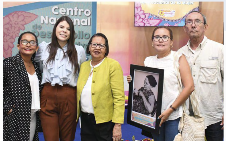
Inauguración del Centro Nacional de Desarrollo del Talento Creativo “Nieves Cajina”

Este nuevo centro tiene como propósito ser un catalizador del talento, de la creatividad, el conocimiento y la experiencia de todos aquellos protagonistas emprendedores, artesanos y profesionales que desean especializarse o complementar su talento para la prosperidad.