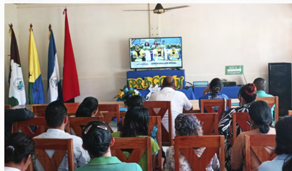
Comunidad universitaria de URACCAN participando en la lección inaugural del año académico 2023.

URACCAN apuesta desde su modelo de educación profesional, al fortalecimiento de las capacidades innovadoras del estudiantado, promoviendo el emprendedurismo de la población del Caribe nicaragüense, impulsado en las aulas de clases y desde los Centros de Innovación con los que cuenta la Universidad.