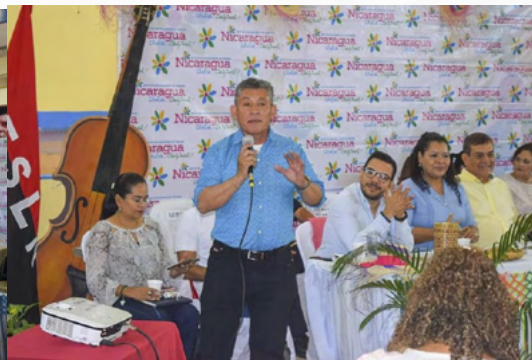
Encuentro con protagonistas y prestadores de servicios turísticos de Matagalpa