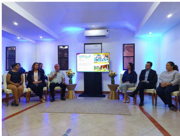
Autoridades de nuestro Buen Gobierno Sandinista Presentan Mapas Interactivos de Casas de Cultura y Creatividad y Museos de la Revolución