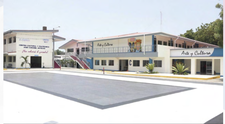
Instalaciones del Centro Cultural y Politécnico José Coronel Urtecho, Managua.

Este centro de formación es parte del trabajo conjunto y complementario entre INATEC, MINED, INC, Cinemateca Nacional, Teatro Nacional Rubén Darío, MINJUVE, la Secretaría de Economía Creativa y Naranja de la Presidencia, Movimiento Cultural Leonel Rugama, aportando al desarrollo cultural, social y económico de nuestro país.