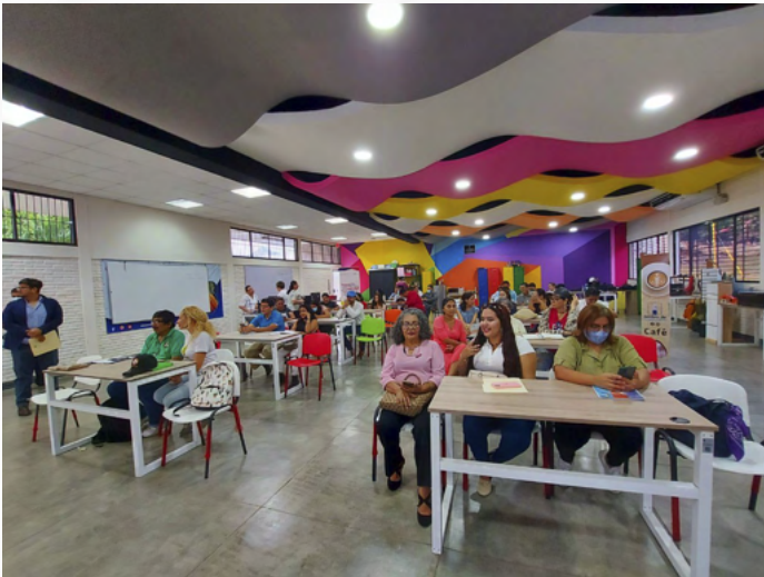
El Centro de Innovación y Diseño de la UNAN-Managua, es el espacio donde se desarrolla el Curso de Certificación en Diseño de Producto y Gestión de Marca

A través de este curso, el Centro de Innovación y Diseño de la UNAN-Managua realizará la primera certificación nacional, donde las y los protagonistas generarán nuevas propuestas y prototipos de productos, aplicando técnicas y metodologías de innovación abierta, permitiendo la exploración y generación de soluciones creativas a problemas y oportunidades desde el diseño.