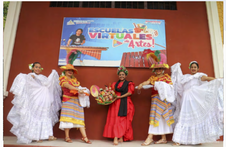
Lanzamiento de la Escuela Virtual de Marimba de Arco

Las Escuelas Virtuales son el resultado del trabajo coordinado y conjunto del Teatro Nacional Rubén Darío, el Instituto Nicaragüense de Cultura, la Secretaría de Economía Creativa e INIFOM.