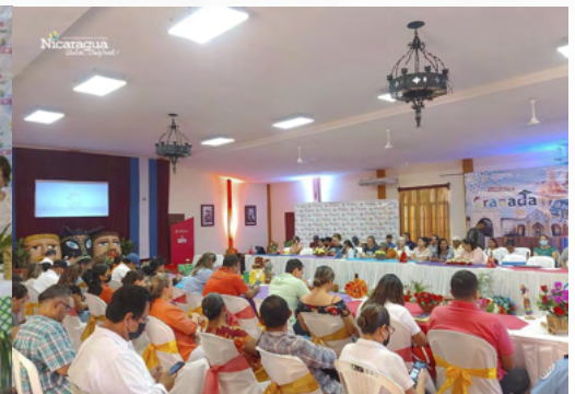
Encuentro con protagonistas y prestadores de servicios turísticos de Granada

En el marco del Plan Nacional de Encuentros con Emprendedores y Prestadores de Servicios Turísticos, desarrollado nuestro Buen Gobierno Sandinista entre los meses de enero y febrero, desde la Secretaría de Economía Creativa y Naranja de la Presidencia, se presentaron las iniciativas y planes 2023, para el fomento del Turismo Creativo y Cultural.