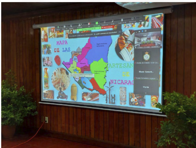
Mapa de las Artesanías de Nicaragua presentado por el INC a las Comisiones Locales de Economía Creativa de la red Nacional de Ciudades Creativas.