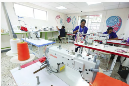
Sala Textil del Centro Nacional para el Desarrollo del Talento Creativo “Nieves Cajina”.