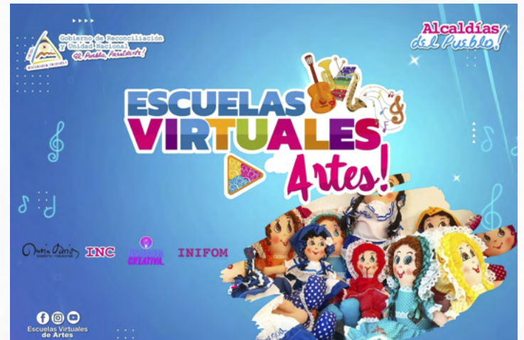
Foto: Escuela Virtuales de Arte amplía su oferta de cursos